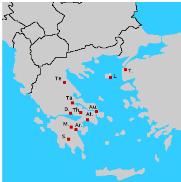
A. = Athén, L. = Lemnosz, T. = Trója, D. = Delphoi, Au. = Aulisz, Te. = Thesszália, Ta. = Taurisz, Th. = Thébai, M. = Mükéné, Ar. = Argosz, S. = Spárta

Antigoné és Iszméné visszamennek Thébaiba, szeretnék meggátolni fivéreik gyilkos viadalát.