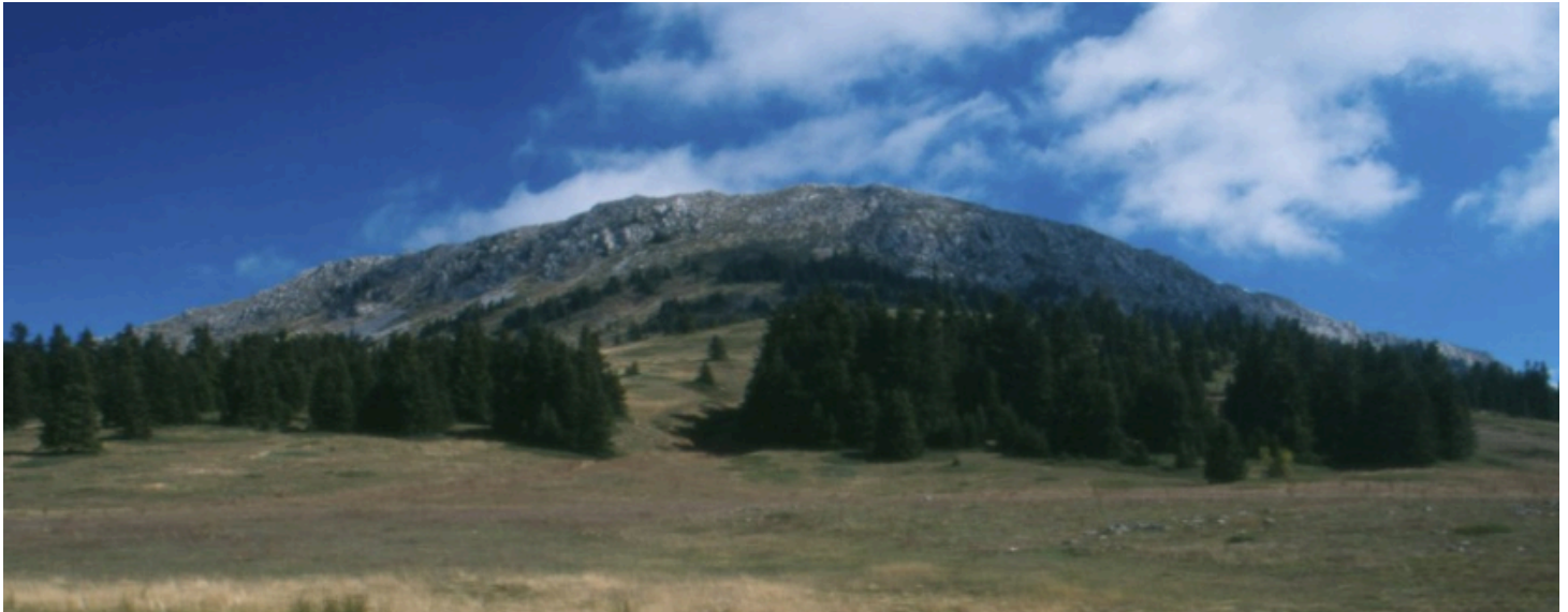
az Oité-hegy ma

Közben a köntös már azonban eljutott Héraklészhez, akinek az halálos sérüléseket okoz. Héraklész megérti, elért élete végére, s beteljesült a jóslat, hogy nem élőlény fogja okozni halálát, hanem halott lény. Halála előtt még megparancsolja fiának, vigye fel őt az Oité-hegy csúcsára, s ott égesse el holttestét.