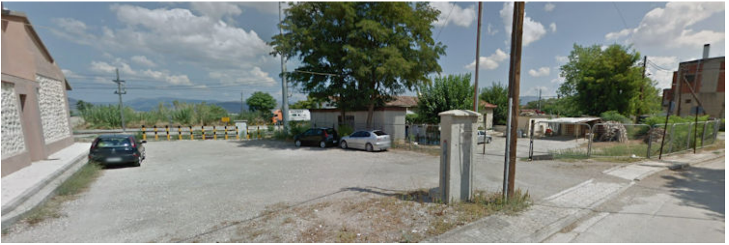
Thébai (újgörögül: Thiva) vasútállomása napjainkban